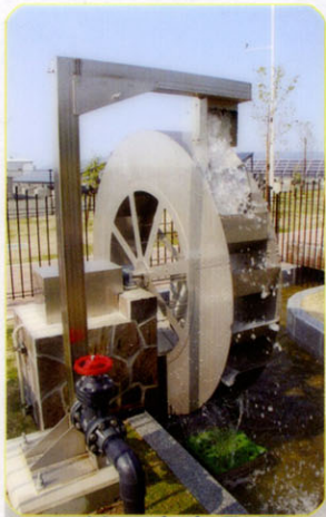
マイクロ水力発電