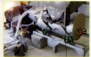
小規模バイオマス発電