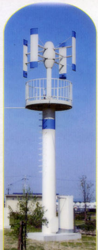
マイクロ風力発電