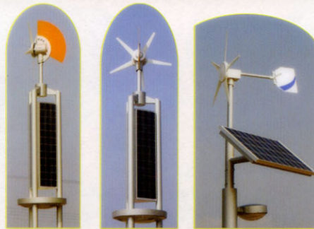
小型ハイブリッド発電(太陽光・風力)